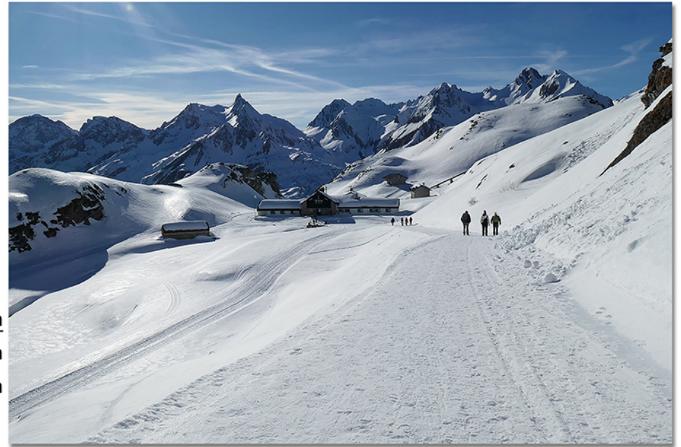
De Rossi Liliana STRADE INNEVATE - Rifugio Maria Luisa, Alta Val Formazza

2025 NOVEMBRE 1 2 | 3 4 5 6 7 8 9 | 10 11 12 13 14 15 16 | 17 18 19 20 21 22 23 | 24 25 26 27 28 29 30 |