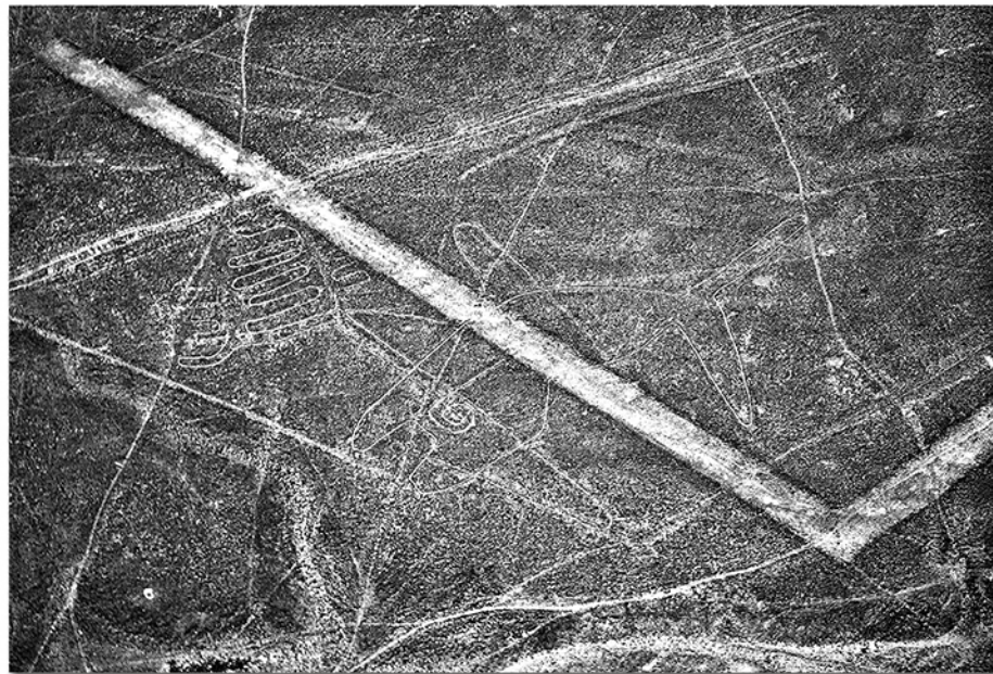
Racchi Ezio LE STRADE DI NAZCA