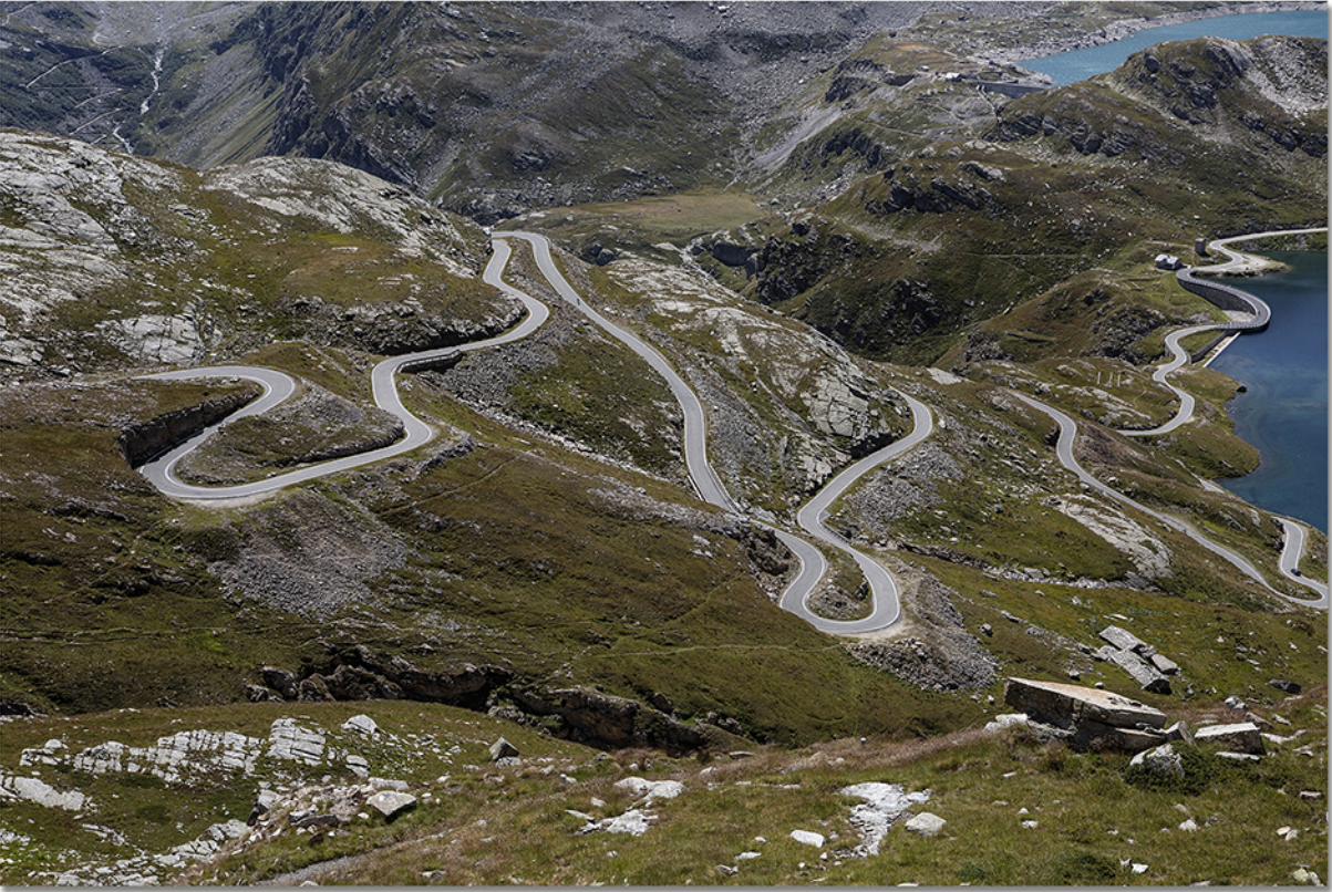
Presti Domenico CURVA DOPO CURVA