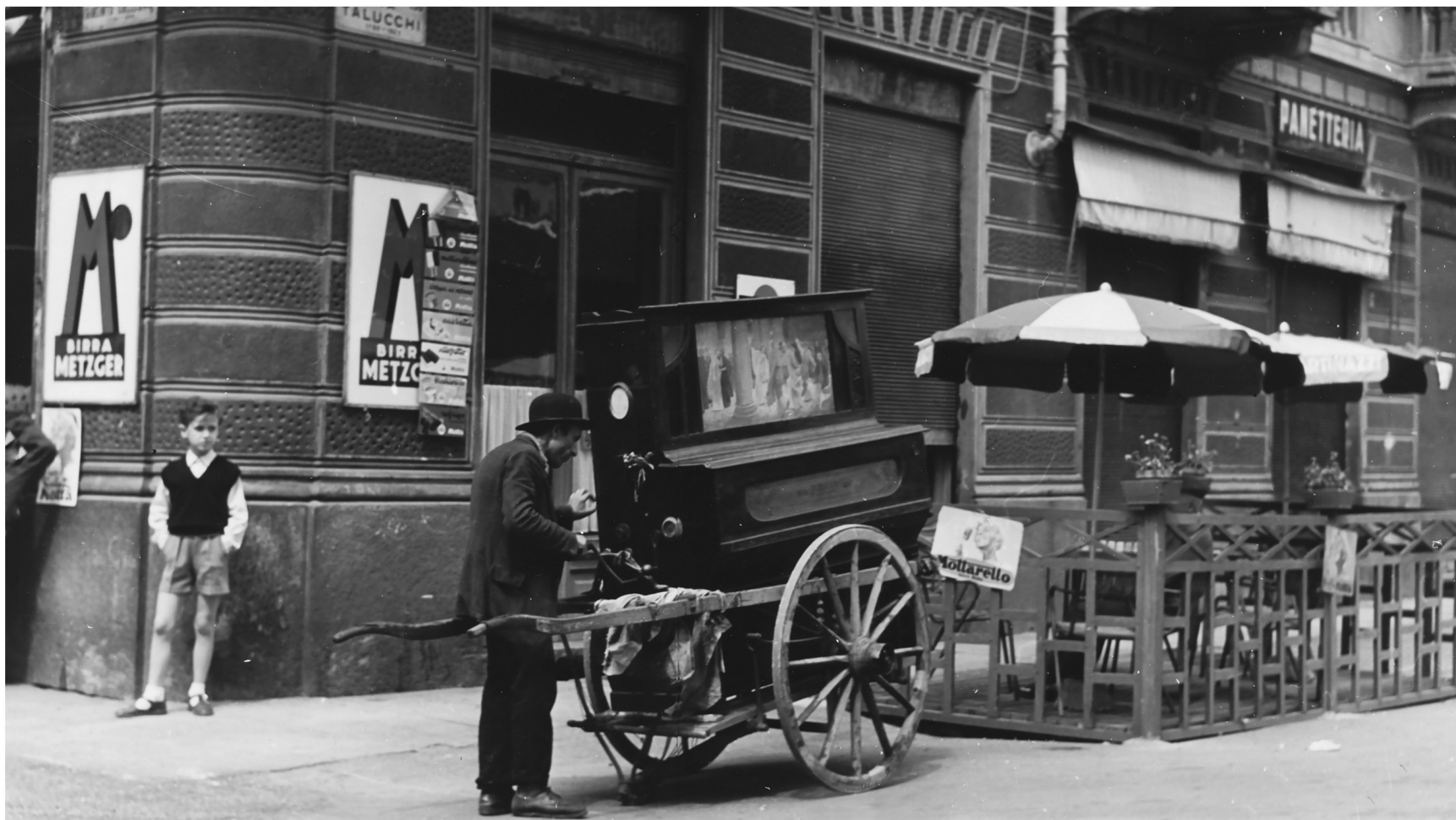
L'organetto - Torino 1954

La Mostra collettiva STRADE (qui una selezione di immagini) è un lavoro corale fatto di sguardi diversi e complementari, un grande libro aperto sulle strade del mondo e su quelle della mente e del cuore (E.Mongiat)