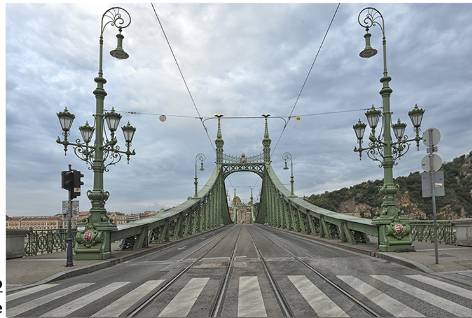
Garavaglia Roberto BUDAPEST - ponte per unire